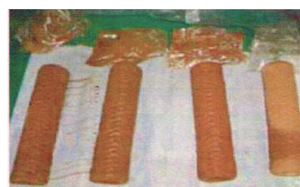
從過濾器取下來的髒污