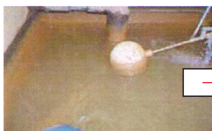
磁氣式活水器 安裝前一個月

自從停止投入抑制水垢的藥劑之後，在夏天運轉時完全沒有問題。（未安裝前經常會產生問題）。