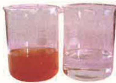
安裝前 安裝後十天