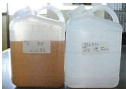
安裝前 安裝後十天